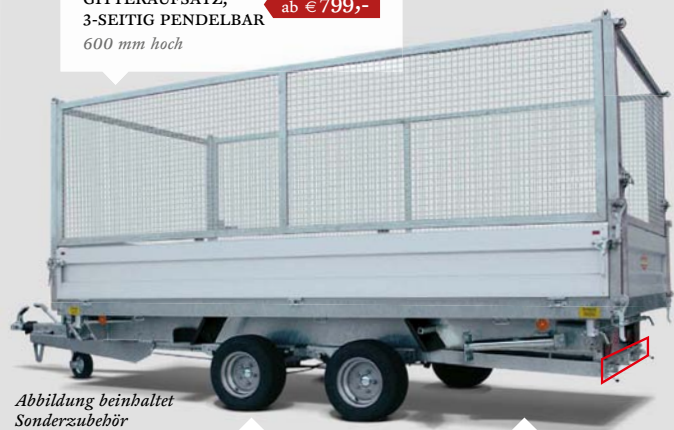
Abbildung beinhaltet Sonderzubehör