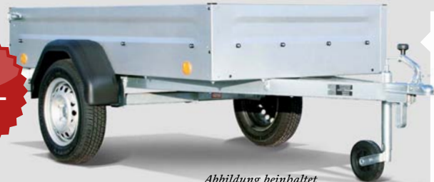
Abbildung beinhaltet Sonderzubehör